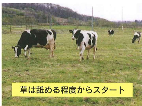
草は舐める程度からスタート

ならし放牧の目的は、乳牛を外気温に馴らし、第一胃内のルーメン微生物をサイレージや乾草などの貯蔵飼料から放牧草に対応させることにあります。成牛のならし放牧は、初産牛などの放牧未経験牛で2週間、1ヵ月程度、経験牛では10日間程度必要です。このため、草丈10cm程度の草を舐める程度の放牧草からスタートし採食量が徐々に増加するようにします。