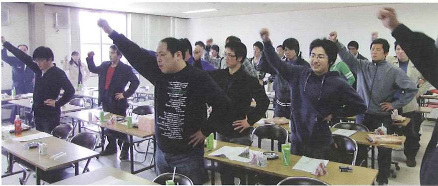
第37回 中春別農業協同組合青年部通常総会