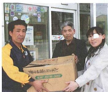
中春別農協給油所に贈って大変喜ばれました