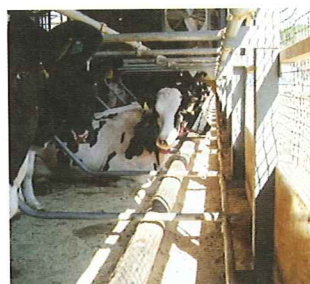
写真2 直射日光が当たるため顔を前に出さない牛たち