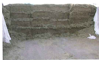
写真4 きれいな取り出し口のサイレージ

また、暑熱ストレスによつて乾物摂取量が低下する場合、栄養濃度を高めるなどの対策が必要となります。詳しくは普及センターまでお気軽にお問い合わせください。