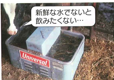
写真3 汚らした水槽