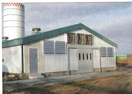
写真1 トンネル換気による暑熱対策の事例

暑熱時は、呼吸や汗に含まれる水分産生量が増えています(表1)。暑さと湿度対策として通常よりも風通しを良くして換気に努めます。