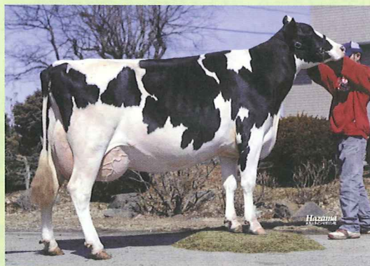
ライブリー デ コール プリンセス ダイアナ (05.05) H17.9.9生 山田 光男 父:レーガンクレスト ダンディー ET 母:ライブリー デ コール プリンセス レテイ 90 祖母:ライブリー デ コール クリエーション プリンセス 90