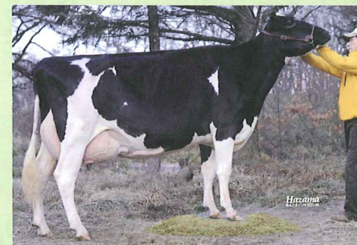
セイコー ロクセット シンフォニー ET (07.01) H16.10.16生 宗像 宏充 父:レーガンクレスト エルトン ダーハム ET 母:YMD ロクセット モア ET 91 姉:YMD ロクセット ギブソン ビル ET 90