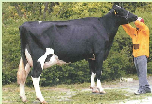
ライプリー スポツテイ ジェスロ (05.06) H18.5.8生 山田 光男 父:ロイレーン ジェスロ ET 母:ライプリー スポツテイー エルトン 91 祖母:ライプリー スポツテイー ストーム 92 曾祖母:ライプリー スポツテイー リンデイ ET 90