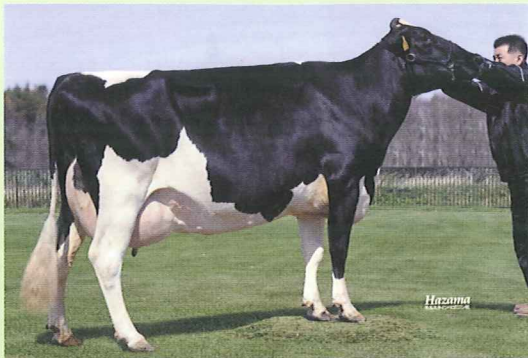
アビリティファーム アクトレス ピーターチエ (07.01) H16.2.4生 橋本 幸二 父:ミスター マンハツタン ET 母:アビリティファーム ストーム ピーターチエ 92 祖母:アビリティファーム リンデイ ピーターチエ 90 曾祖母:アビリティファーム ポテント ピーターチエ 92 高祖母:アビリティファーム クリス ピーターチエ 91